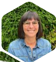
An Belmans Administratief medewerker

De administratieve dienst is telefonisch bereikbaar elke werkdag tussen 9u en 12u of op afspraak.