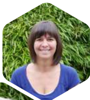
An Belmans Administratief medewerker